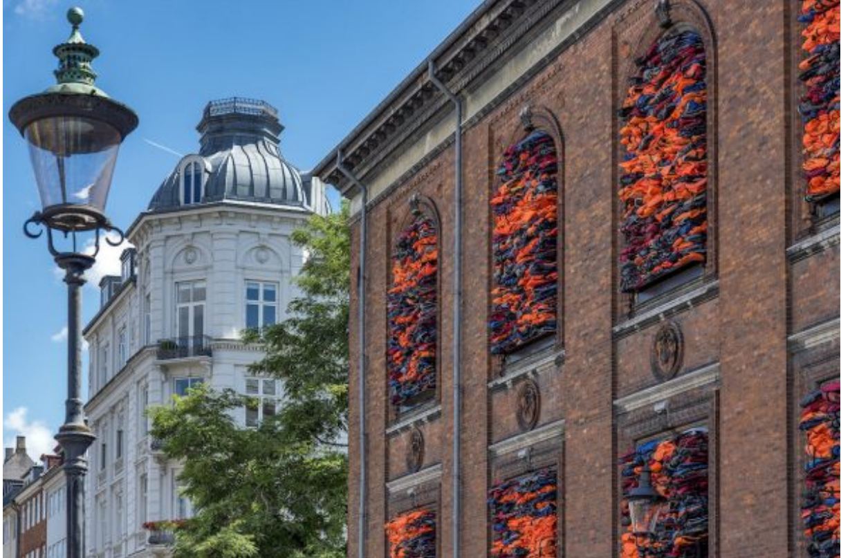
Ai Weiwei (foto artnet)

A artslife.com/2019/09/05/sfruttamento-improprio-delle-opere-darte-per-scopi-di-marketing-il-caso-ai-weiwei-volkswagen/