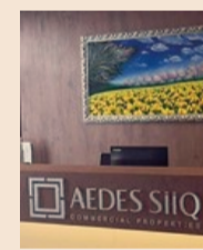
Scissione. Fra le attività immobiliari core e quelle di trading e opportunistiche