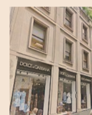
Il palazzo D&G. Sul piatto 200 milioni dal gruppo Hines per rilevare l'immobile

È alle battute finali la trattativa con la quale il gruppo statunitense Hines sta per rilevare (per una cifra superiore ai 200 milioni di euro) il palazzo di Dolce & Gabbana ubicato in via della Spiga, a Milano, nel cuore del quadrilatero della moda. L'immobile ha una superficie di 8mila metri quadrati, di cui 1.600 affittati da D&G. La casa di moda sta tuttavia per traslocare.